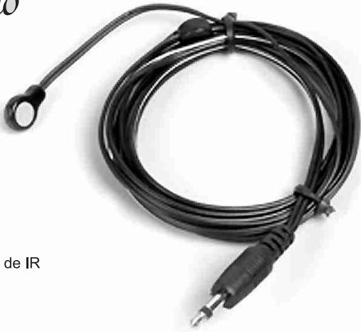
EIR-XT Cabo emissor de IR