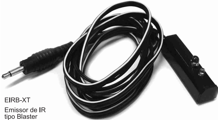
EIRB-XT Emissor de IR tipo Blaster