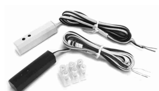
RIRQ-XT / IR receiver