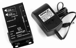
CBLK-XT / C. Block

Conheça outros produtos do sistema AMCP de IR