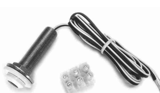
RIRT-XT / IR receiver