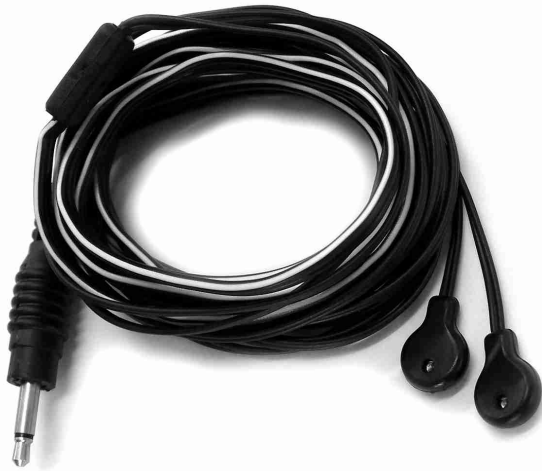
EIRD-XT Cabo duplo emissor de IR