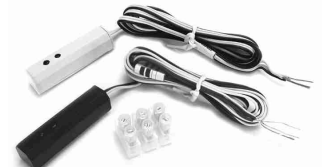
RIRQ-XT / IR receiver