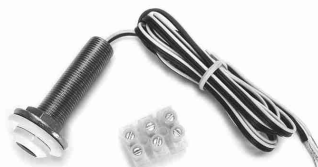
RIRT-XT / IR receiver