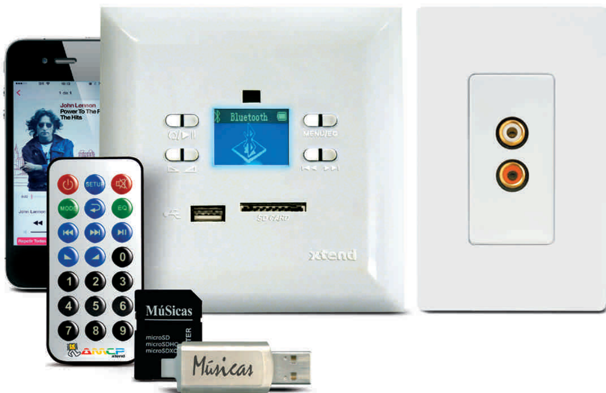
EAL-XT Entrada de Audio local