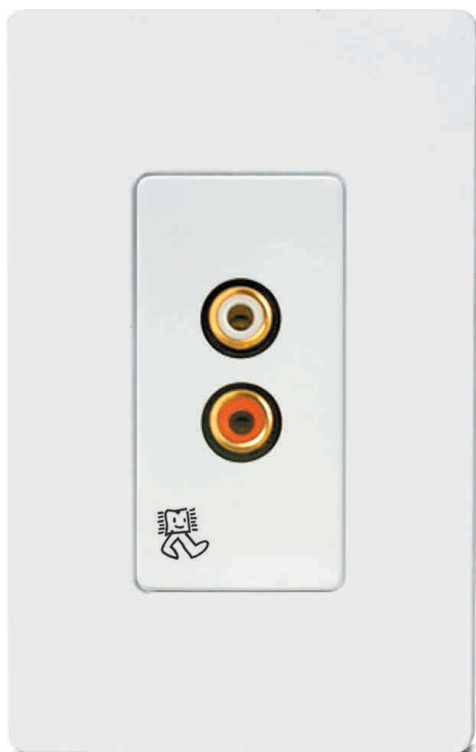
EAL-XT Entrada de Audio local