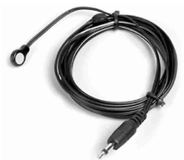
EIR-XT / IR emitter