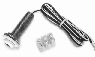
RIRT-XT / IR receiver