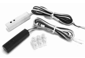
RIRQ-XT / IR receiver