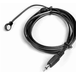
EIR-XT / IR emitter