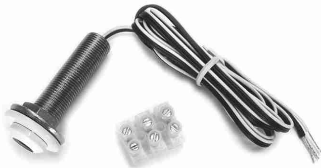
RIRT-XT Receptor de IR